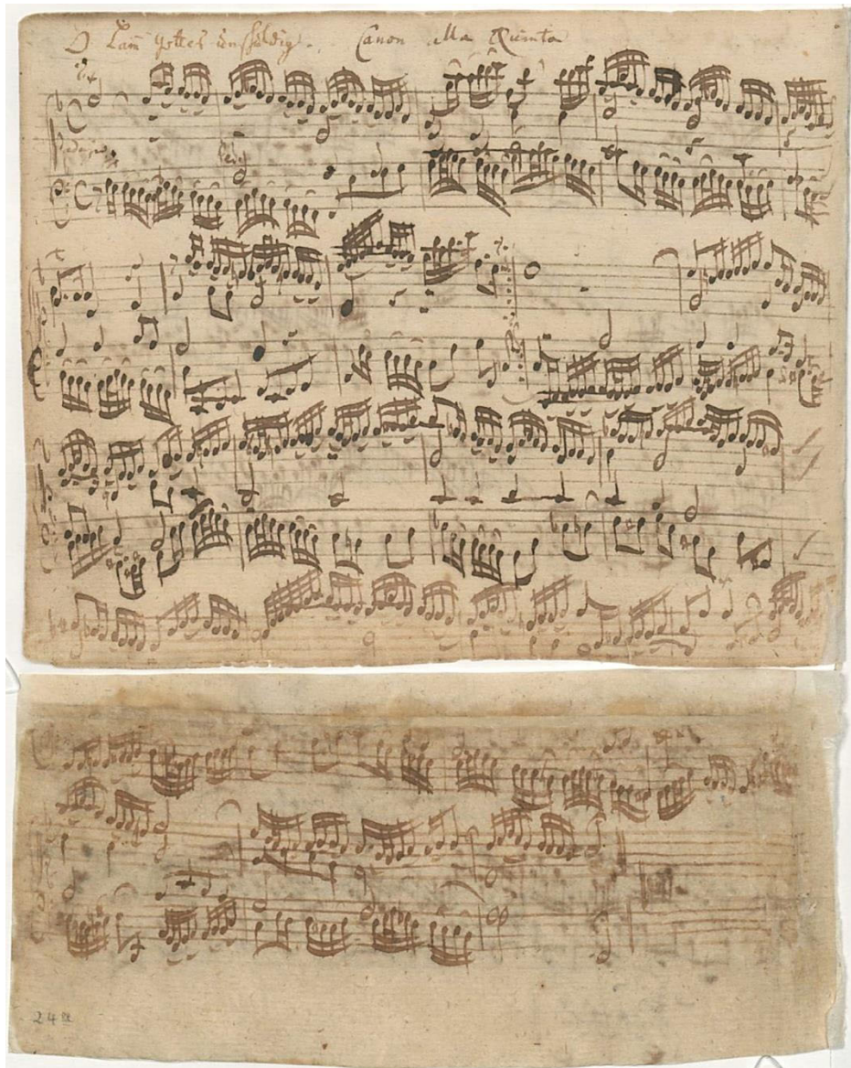
Autografo del preludio corale